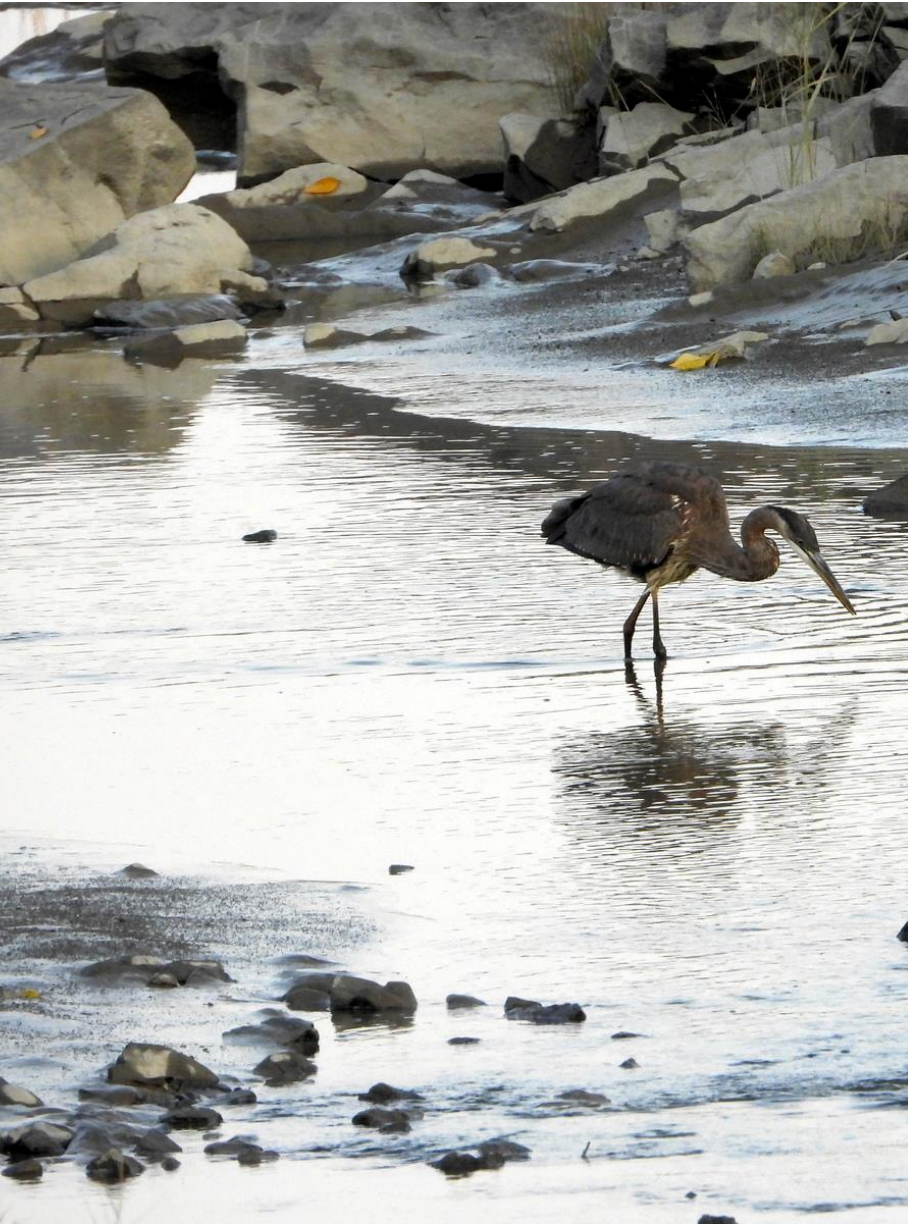
Héron rivière Tortue à l'Islet – Photo gagnante de 2021 – Claude Ménard