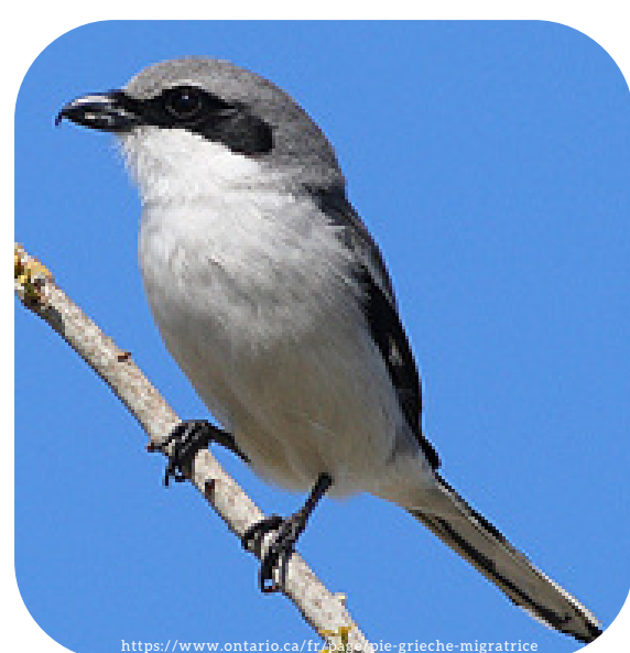
Pie-grèche migratrice Statut menacée

Au Québec, la loi peut attribuer deux statuts aux espèces : vulnérable (si sa disparition est redoutée à long terme) et menacée (si sa disparition est redoutée à court et à moyen terme).