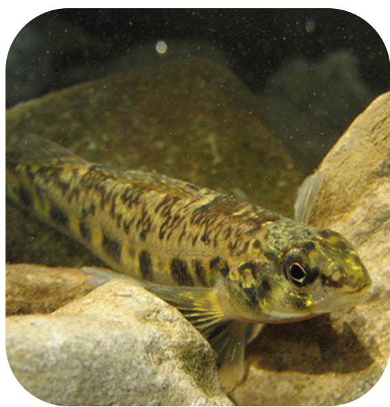
Fouille roche-gris Statut vulnérable

Au Québec, la loi peut attribuer deux statuts aux espèces : vulnérable (si sa disparition est redoutée à long terme) et menacée (si sa disparition est redoutée à court et à moyen terme).